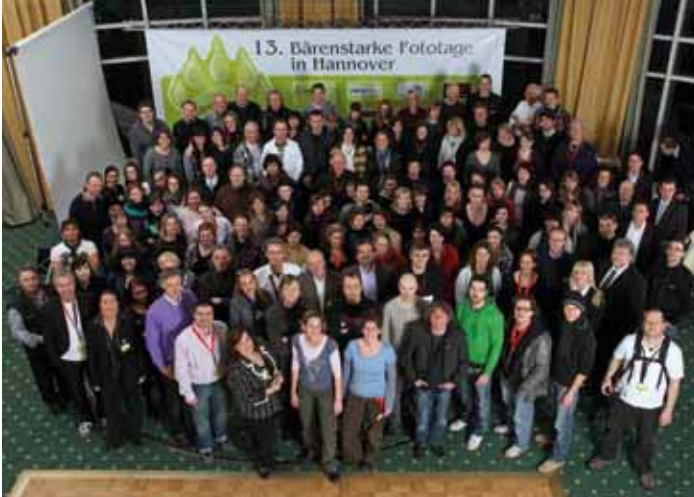
Alle im Bild: Teilnehmer, Organisatoren und Sponsoren

Die „Bärenstarken Fototage“, Kult-Workshop für den fotografischen Nachwuchs, fanden in diesem Jahr zum 13. Mal statt: Ort des Power-Wochenendes vom 13. bis 15 März war das Mercure Hotel Atrium in Hannover. Der Veranstalter, der Centralverband Deutscher Berufsfotografen (CV), nutzte die Gelegenheit auch zur Durchführung seiner Mitgliederversammlung. Höhepunkt der „Bärenstarken Fototage“ war die Gala am Sonntagabend mit der Verleihung des „Foto-Oskars“.